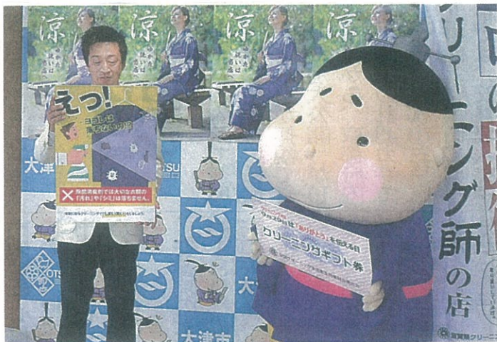
クリーニングギフト券を贈呈されたおおつ光ルくん(右)と、クリーニング利用をPRする組合員—大津市・市役所

す」と喜んでいた。県のキャラクター「キャッフィー」 「うおーたん」にもギフト券が贈られた。(小川卓宏)